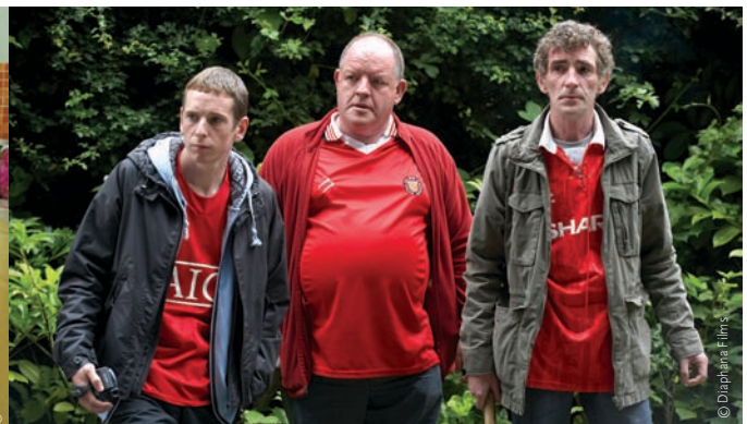
Deux des six films présentés par Wild Bunch en sélection officielle à Cannes en 2009, The Time That Remains d'Elia Suleiman et Looking for Eric de Ken Loach