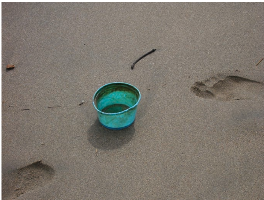
L'hiver ailleurs d'Anne Penders

Les paysages ne sont donc pas nécessairement ceux que l'on attend. Une balade sur