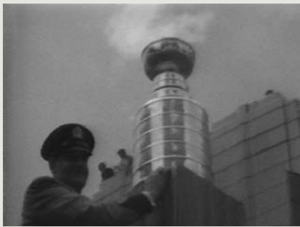
Pea Soup (1978)

y introduisant une conception très contrastée du montage, quasi eisensteinienne. Les plans des cochons qu'on envoie à l'abattoir, montés parallèlement aux plans de foule, constituent en ce sens une sorte de morceau de bravoure, certes un peu naïf, mais qui permet aux coréalisateurs de prendre leurs distances avec le cinéma direct, tendance qui ira en s'affirmant.