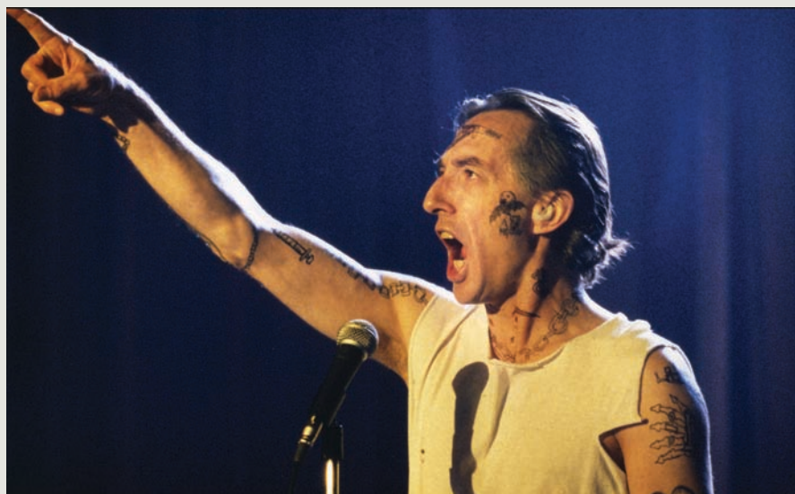
Richard Desjardins chante Le screw dans Le party (1989)