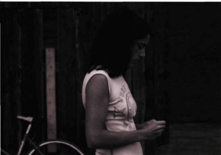
Elle veut le chaos de Denis Côté

semblaient s'adresser à un public restreint, ont tenu la dragée haute à des films dits commerciaux, leur longévité en salles devenue exceptionnelle (on pense ici à Ce qu'il faut pour vivre , de Benoit Pilon); quoique des films programmés pour 2008 ne sortiront qu'en 2009 après leur passage dans des festivals, bloqués par des écrans encombrés, on peut toutefois reconnaître que quelque chose s'est produit, qui n'est pas une secousse, mais plutôt une éclaircie, qui augure bien, car plusieurs films remarquables cette année sont signés par des auteurs d'une nouvelle génération. Il n'y a pas eu véritablement de raz-de-marée public, des records d'assistance, mais plutôt une fréquentation à la fois paisible et confiante des films, dont les motifs esthétiques étaient généralement exigeants; des films qui ne se confrontaient pas aux autres pour briser la baraque du box-office mais s'appuyaient sur un désir de cinéma évident, emportant éventuellement l'adhésion du spectateur. Ils n'étaient pas tous des chefs-d'œuvre, loin de là. Ils étaient toutefois assez irréductibles dans leurs propositions esthétiques pour qu'on se réjouisse que d'autres types de cinéma, d'autres modes de narration et de représentation puissent désormais apparaître et se développer sans avoir l'impression que ce sont des exceptions ou des accidents.