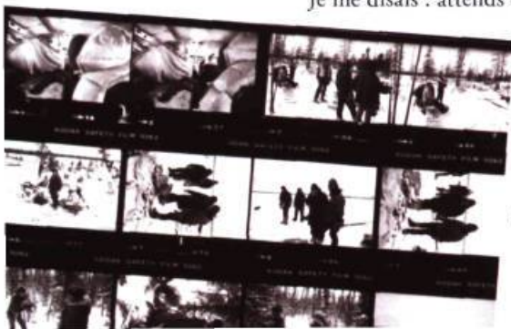
Le dernier glacier

S'ils t'adressent la parole, écoute-les et tu peux même engager une conversation, mais ne pose pas