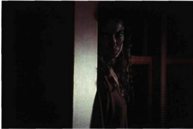
La vie fantôme (1992)

exploiter nos mines. On fait un peu la même chose en allant vers le Nord que ce que les Américains ont fait en allant vers l'Ouest.