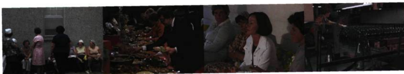
«Chronique de la vie quotidienne» Mercredi, petits souliers, petit pain (1977)