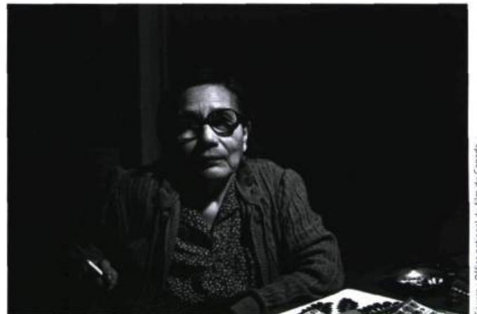
Le dernier glacier (1984)

Vous semblez avoir une manière assez unique de travailler. Je pense entre autres à la façon dont vous avez conçu Trois pommes... en élaborant en même temps l'histoire, la musique, la conception sonore. Cette méthode est-elle unique à ce film?