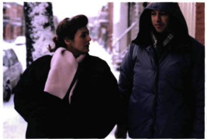
Trois pommes à côté du sommeil

nier glacier. On s'intéressait alors aux effets de la fermeture de la mine appartenant à l'Iron Ore. Schefferville représente un peu ce qu'était l'Ouest pour les Américains : le territoire à découvrir, à investir, à occuper, à exploiter. Notre version québécoise de l'Ouest se situe dans le Nord, et c'est pourquoi toute cette région, avec le Labrador et les zones périphériques, m'a toujours fasciné. Mon frère avait travaillé à déboiser pour permettre l'installation des lignes électriques alors que sa femme l'attendait quelque part, et on avait souvent parlé de ça avant que j'entreprenne Tendresse ordinaire .