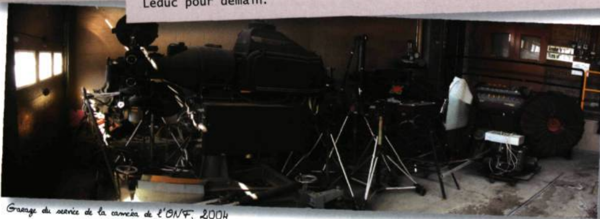
Garage du service de la caméra de l'ONF, 2004

Parfait... je me booke. En attendant, j'essaie de finir un texte sur Leduc pour demain.