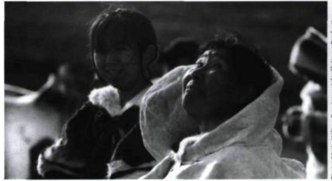
Atanarjuat, la légende de l'homme rapide (2001).