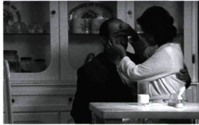
Sangre d'Amat Escalante.

Pourtant, et c'est là le plus étonnant, les personnages ne sont pas à proprement parler haïssables. Ni monstres calculateurs, ni victimes, ils vivent une vie qu'on voudrait consi-