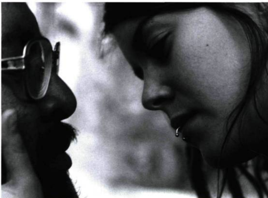
Batalla en el cielo de Carlos Reygadas.

Une claque à donner... Une révolte à mener contre une télévision qui anesthésie le spectateur... Tout cela donne bien évidemment très envie de voir Flandres . Cela donne envie également de revenir sur les deux premiers films de Carlos Reygadas, Japón et Batalla en el cielo , et sur le premier film d'Amat Escalante, Sangre , car il semble bien que ces deux jeunes cinéastes mexicains partagent le point de vue de Dumont. Et puis c'était l'occasion de prendre des nouvelles du Mexique. Certes trois films ne font pas une école, un mouvement ou une Nouvelle Vague. Pourtant ils sont suffisamment proches et forts pour qu'on y revienne, d'autant plus que le cinéma latino-américain, malgré un contexte de production souvent difficile, ne cesse de nous réserver d'heureuses surprises.