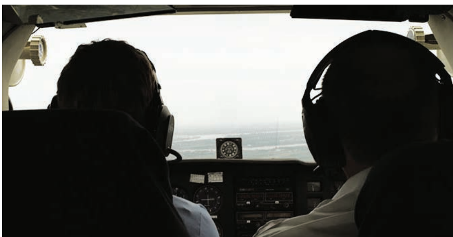
LE FUTUR PROCHE (2012) de Sophie Goyette

l'exercice reste périlleux car guidé par la subjectivité de nos choix.