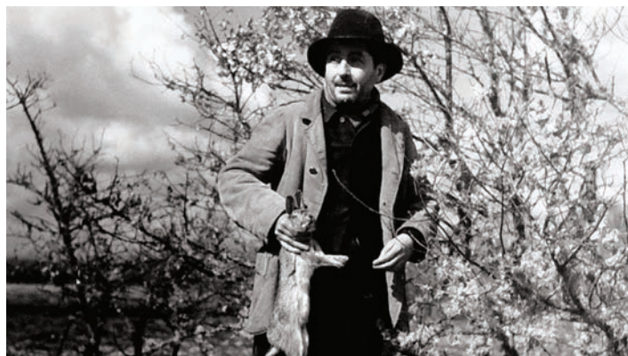
LA RÈGLE DU JEU (1939)

de Pascal Mérigeau, Paris, Flammarion, Grandes biographies, 2012, 1102 pages