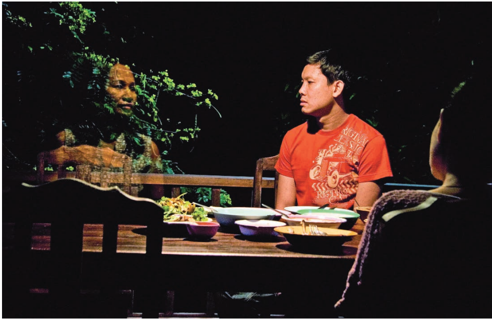
ONCLE BOONMEE, CELUI QUI SE SOUVIENT DE SES VIES ANTÉRIEURES (2010)

expérience d'un récit: la linéarité du fil narratif (ou du moins la possibilité de recomposer sa logique spatiotemporelle lorsque fragmentée), la différenciation des registres (fictionnel, documentaire), la séparation des modes d'existence et d'expression (fantastique, réaliste, poétique), des durées s'accordant à un rythme au service de la compréhension de l'action, etc. Rien de tout cela ne va de soi avec ce cinéaste, mais tout se passe comme si, en jouant avec les limites et en les brouillant, il nous faisait du même coup prendre conscience de celles-ci (du fait que nous en soyons dépendants) et de ce qu'elles signifient. Troublés dans nos attentes, sur le fil désormais tenu de notre appréhension, c'est paradoxalement avec plus de force et d'émerveillement que nous redécouvrons les pouvoirs du cinéma et y adhérons – à moins que, et cela se produit pour bon nombre de spectateurs, il faut bien le dire, le fil ne se rompe.