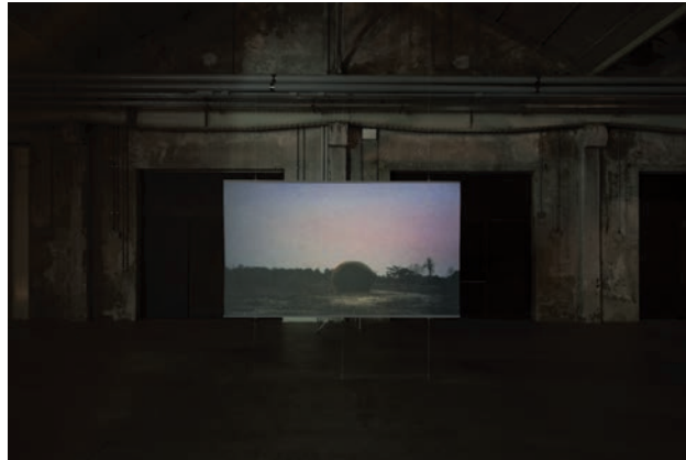
MAKING OF THE SPACESHIP et A DEDICATED MACHINE deux des vidéos qui composent PRIMITIVE (en bas, au Hangar Bicocca de Milan)

les extirper du refoulement et de l'oubli avant leur extinction, afin qu'elles puissent s'incarner autrement et permettre de repenser le monde. Dans le cas de Primitive on cherche, par la création de différents scénarios fictifs, à « implanter une mémoire » dans un lieu où les souvenirs sont éteints 2 . À travers Uncle Boonmee c'est du cinéma qu'Apichatpong désire se souvenir, en rendant hommage aux films qui ont marqué son enfance et qui aujourd'hui tombent dans l'oubli, les films thaïs en 35 mm à grand déploiement autant que les films aux décors de carton-pâte ou les feuilletons télévisés 3 .