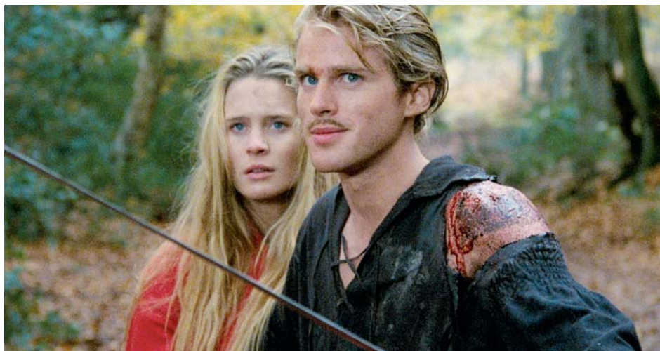
→ The Princess Bride de Rob Reiner (1987)