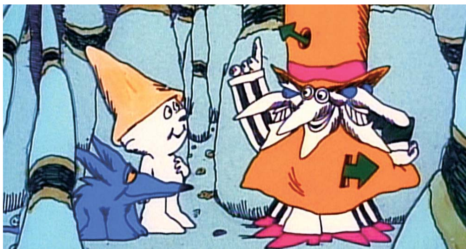
↑ The Point of View of a Wolf (1971)