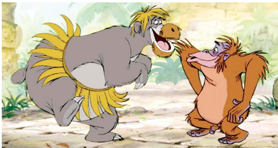
→ The Jungle Book de Wolfgang Reitherman (1967)