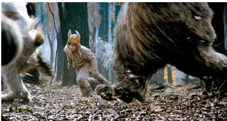
↑ Paddington 2 de Paul King (2017) → Fantastic Mr. Fox de Wes Anderson (2009) → Where the Wild Things Are de Spike Jonze (2009)