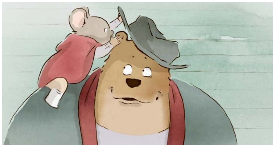
→ Ernest et Célestine de Benjamin Renner, Vincent Patar & Stéphane Aubier (2012)