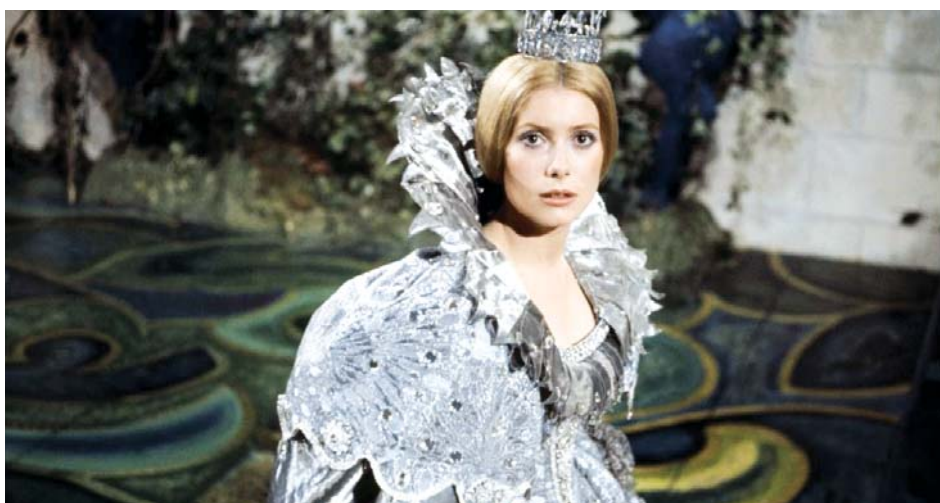
Peau d'âne de Jacques Demy (1970)