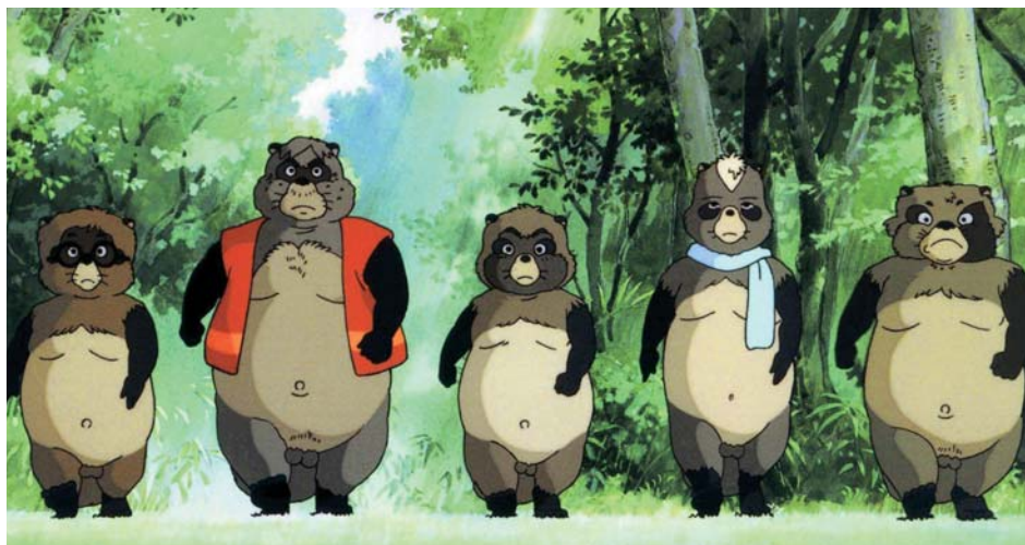
↑ Pompoko de Isao Takahata (1994)