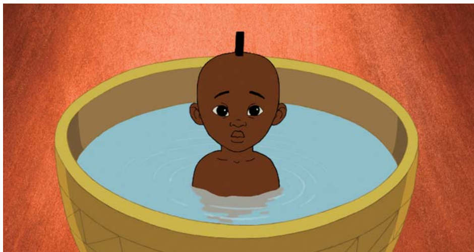
↑ Kirikou et la sorcière de Michel Ocelot (1998)