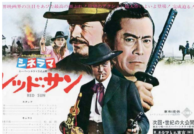
Soleil Rouge de Terence Young (1971)