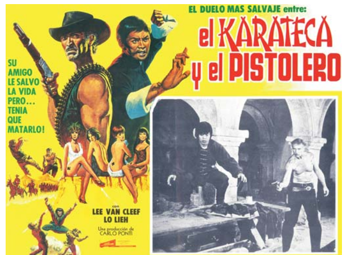
La brute, le colt et le karaté de Antonio Margheriti (1974)

Au sein de ce sous-genre en vogue à l'époque, La brute, le colt et le karaté (Antonio Margheriti, 1974) est particulièrement digne d'intérêt. Cette coproduction entre l'Italie et les studios hongkongais de la Shaw Brothers (la Mecque ultime du cinéma martial), orchestre la rencontre entre deux géants, Lee Van Cleef (pour le Western) et Lo Lieh (pour le Kung-fu), star de 169 films dont le classique