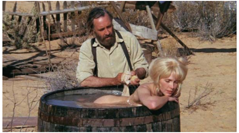
The Cheyenne Social Club de Gene Kelly (1970) et The Ballad of Cable Hogue de Sam Peckinpah (1970)

Mel Brooks, est une satire brillante de la société américaine. Dans une petite ville où tout le monde s'appelle Johnson, on est bien entre-soi. Et ce confort communautaire se voit mis à mal le jour où un travailleur noir prend le poste de shérif. Le film de Mel Brooks est une succession frénétique de gags irrévérencieux qui caricaturent à souhait l'univers du Western dans la pure tradition du slapstick , citant même Tex Avery. Brutes épaisses, femmes réduites à leurs attributs, notables écervelés, citoyens racistes : tous les personnages types de l'Ouest y passent. Et si notre shérif noir est très mal vu, il lui suffit d'évoquer le nom de Randolph Scott pour que toute la ville abaisse son chapeau avec respect. Car le Western, c'est bien cela : la sublimation d'un mythe national auquel le cinéma a largement contribué (« It's just like a movie » nous dit Groucho dans Go West ). En invoquant Randolph Scott, Mel Brooks convoque, par la bouche de son shérif noir, une histoire intouchable où, lui, n'a justement jamais eu sa place. Cette histoire, récit fantasmé et ancré dans l'imaginaire par le cinéma, est en effet nécessairement idéologique, avec ses absents, ses préjugés, ses contradictions 1 .