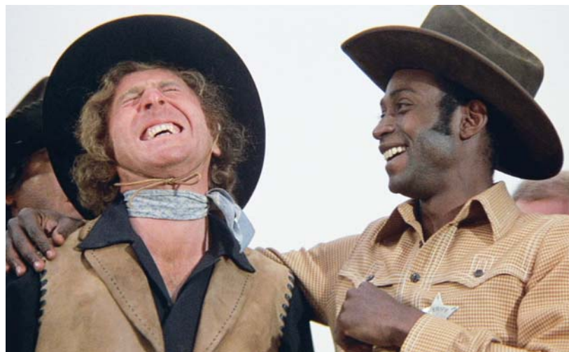
Blazing Saddles de Mel Brooks (1974)

Plus tard, c'est John Ford lui-même qui s'en amusera avec l'un de ses westerns les plus atypiques, Three Godfathers (1948). Le film n'est certes pas une comédie, mais il contient néanmoins une part d'humour qui consiste à voir John Wayne (héros incontournable du genre et héraut de la virilité absolue) se retrouver avec un bébé sur les bras. Dans une scène hilarante, il cherche à badigeonner le bébé avec de la graisse de chariot. Pour la première fois ou presque, nous voyons l'inébranlable John Wayne démuni face à quelque chose. Plus généralement, le Western classique s'est amusé, par touches, à remettre en question la virilité de ses héros. Il suffit de penser à la magnifique scène de My Darling Clementine (John Ford, 1946) dans laquelle Henry Fonda tripote son chapeau nerveusement car il n'ose pas inviter une jolie fille à danser. Il faudra néanmoins attendre les années 1960