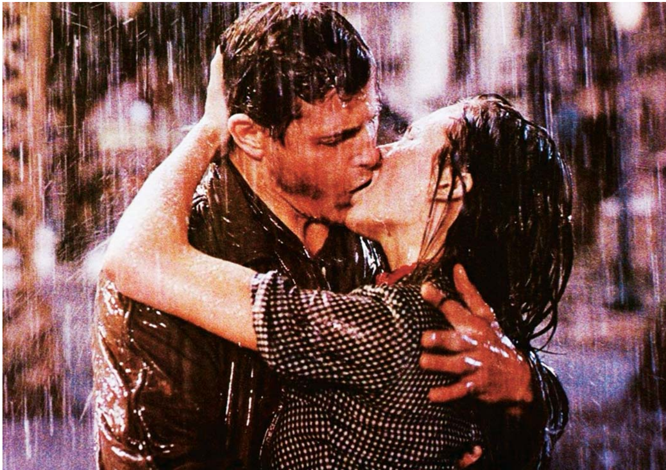
Streets of Fire de Walter Hill (1984)

Contre toute attente et au-delà d'apparences bien trompeuses (Rambo, Conan et ces cohortes de héros machistes), revisiter le cinéma populaire des années 1980, c'est bel et bien plonger dans un monde où les émotions prévalent, où la sensibilité se revendique à fleur de peau. C'est aussi retourner vers l'enfance. Pas juste pour la masse des films alors produits pour un public spécifique, mais aussi pour cette étonnante absence d'inhibition sentimentale qui caractérise grand nombre de productions de cette période et qui ne peut probablement s'observer qu'a posteriori en opposition à d'autres époques. C'est renouer avec un cinéma où l'on pleure pour un rien. Où l'on s'étonne de rire bêtement. Parce que l'amour est beau. Parce que la vie est triste. Parce que l'amitié entre un petit garçon et un extraterrestre d'apparence fécale réussit bel et bien à être plus fort que tout ( E.T. , Steven Spielberg, 1982). On est à l'époque d'un brutal retour