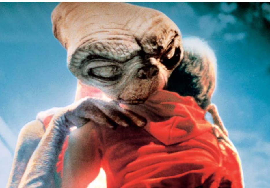
E.T. de Steven Spielberg (1982)

Dans cet art de la manipulation qu'est le cinéma (et dans l'art en général), l'effet de réel a toujours été la source de nombreux clivages. Voir la grande problématique de Platon et sa caverne, là où confortent et divertissent des ombres chatoyantes d'un réel extérieur bien plus complexe et inquiétant. De ce fait, en termes d'esthétique et de narration, beaucoup de choses ont changé dès la fin des années 1980. La roue a tourné et, indéniablement, les émotions en ont pris un coup. Du côté du cinéma d'auteur, l'influence des frères Dardenne se retrouve partout, surtout chez les jeunes cinéastes et ce, encore aujourd'hui. C'est le grand retour à un cinéma dit plus « dramatiquement vrai », plus « social ». Finie l'esthétique des sentiments. Finie l'influence de la pub et du vidéoclip. Terminée la musique qui