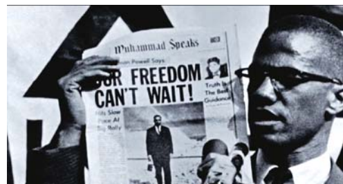
I Am Not Your Negro