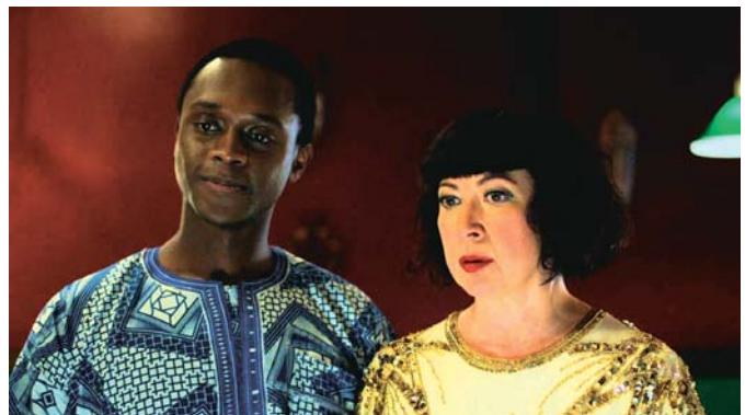
Le Cœur de Madame Sabali (2015)