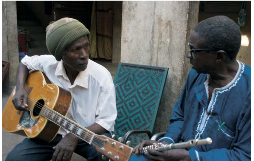
Bamako temps suspendu (2014)

et fait un premier montage de ce matériel sans jamais être « en production ». J'étais plongé dans un état de fièvre encore difficile pour moi à mesurer. C'est là que je vois un point de rupture dans mon travail. Bamako temps suspendu , c'est complètement différent, même si quelque chose de ce que j'ai expérimenté pendant le printemps 2012, qui tient à la présence des choses et des êtres, m'a accompagné dans ce film. Au moment où j'ai filmé ces musiciens, le Nord du Mali était en guerre. Les islamistes interdisaient la musique à Tombouctou, et le gouvernement les manifestations publiques à Bamako. Ce film est venu vers moi comme un moment de joie arraché à la guerre.