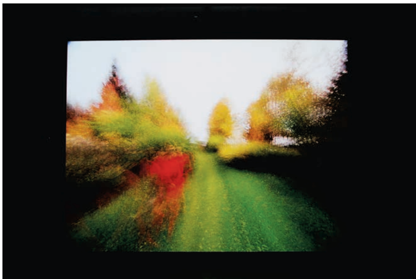
Brouillard , installation. Cinémathèque québécoise (automne 2015)

l'espace du plan, conférant une plus grande induction de sens par le son. L'appel d'air, l'ouverture à la seule perception visuelle s'en serait trouvée amoindrie.