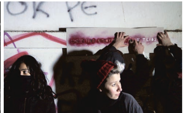
Le mirage de Jean-Claude Guiguet / Les amants réguliers de Philippe Garrel / Film Socialisme de Jean-Luc Godard / Primitive , une installation d'Apichatpong Weerasethakul / Night Cap d'André Forcier / Les Chiens errants de Tsai Ming-liang / From What is Before de Lav Diaz / Révolution Zendj de Tariq Tegui