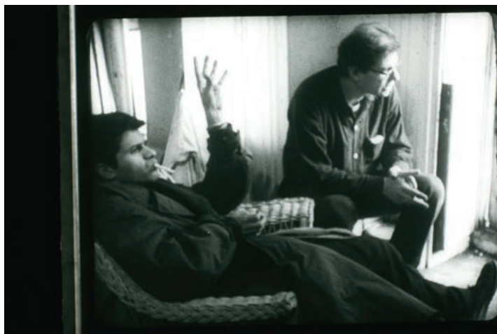
Pull my Daisy (1959)