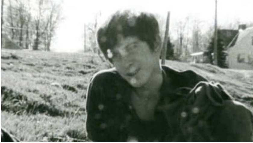
Conversations in Vermont (1972)