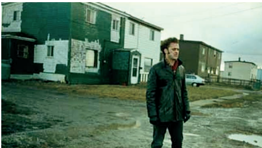
Candy Mountain (1987)