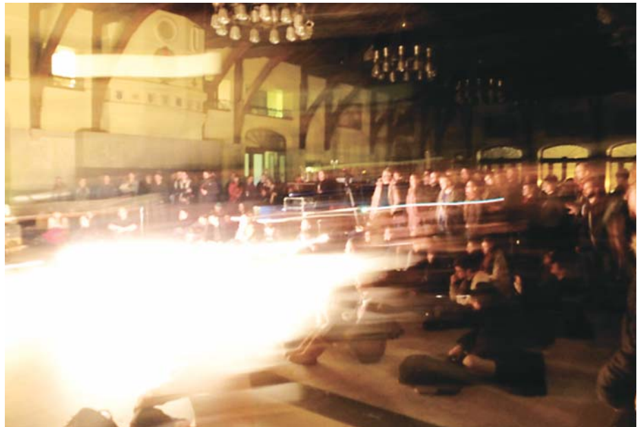
Metal Machine Cinéma, Montréal, janvier 2012. Présentation de l'Institut pour la coordination et la propagation des cinémas exploratoires.