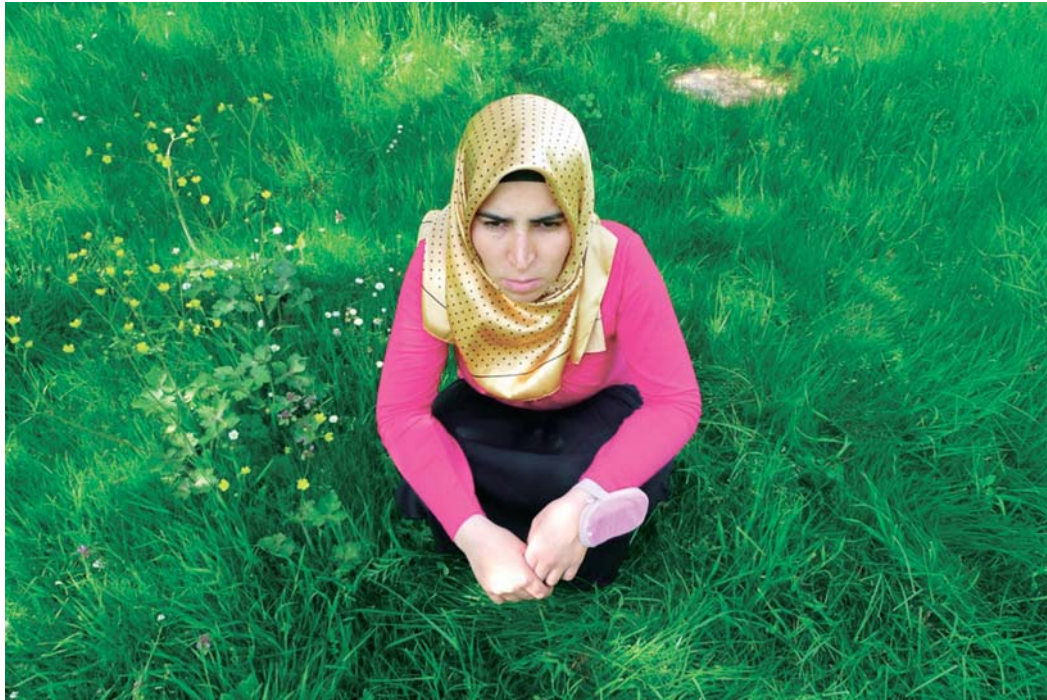
L'aveugle à la broderie, photo tirée de LA DERNIÈRE IMAGE

À l'heure de l'Internet où il est si facile de côtoyer ce que Thomas Hirschhorn nomme « les décombres du spectaculaire et du sensationnel », l'exposition en deux volets consacrée au travail récent de Sophie Calle, Pour la dernière et pour la première fois 1 offre une brèche lumineuse dans le chaos proliférant des images. L'installation multimédia présentée jusqu'en mai au Musée d'art contemporain de Montréal ne manque pourtant pas de gravité car, fidèle à ses préoccupations, l'artiste y décline à nouveau les thèmes de la perte, de l'absence et du désir. Pour qui garde encore en mémoire l'empreinte laissée par l'arborescence de l'événement Prenez soin de vous montré au centre DHC/ART en 2008, projet qui sollicitait le regard de 107 femmes invitées à interpréter à la lumière de leur expérience une lettre de rupture adressée par un homme à Sophie Calle elle-même, l'envoûtement est toujours au rendez-vous. Mais cette fois, le dispositif mis en place surprend et émeut par son épure et sa simplicité. L'art multidisciplinaire de celle qui aime à marier les médiums (photographie, textes écrits et vidéo) pour faire naître des moments de vie singuliers et éphémères accède ici à une forme de totalité ouverte qui s'épanouit avec grâce entre désarroi et ravissement.