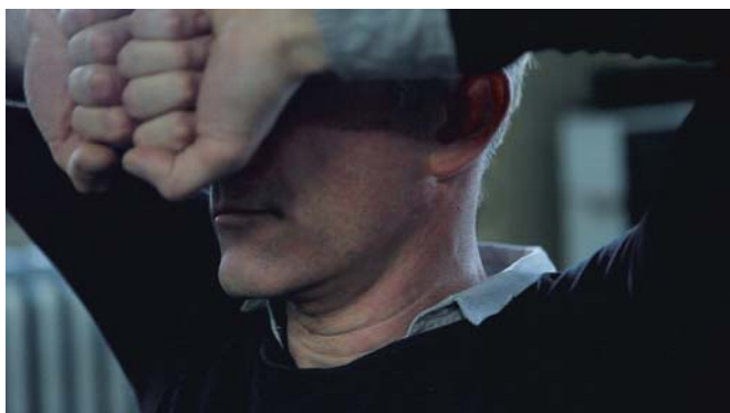
HOMMES À LOUER (1 et 2) et ÉPOPÉE (3)

Les personnages appartiennent à une sorte de tribu avec des liens très forts. La drogue et le sexe les unissent. Ce sont des gens en résistance. On dit que le capital travaille à désubjectiver les personnes pour ensuite les resubjectiver à sa manière. Mais dans cet entre-deux, il y a une possibilité pour les formes de vie de se resubjectiver comme elles l'entendent. C'est dans ces trous-là que la résistance prend un caractère politique. Frantz Fanon parlait du corps de l'homme noir et de l'expérience du colonisé, un corps réduit à l'aspect presque animal. Aujourd'hui, nous sommes tous des colonisés. Mais cette réduction, cette « vie nue » dont parle Agamben offre aussi la possibilité de se resubjectiver de manière inusitée. C'est là qu'est l'utopie, la possibilité d'un monde nouveau.