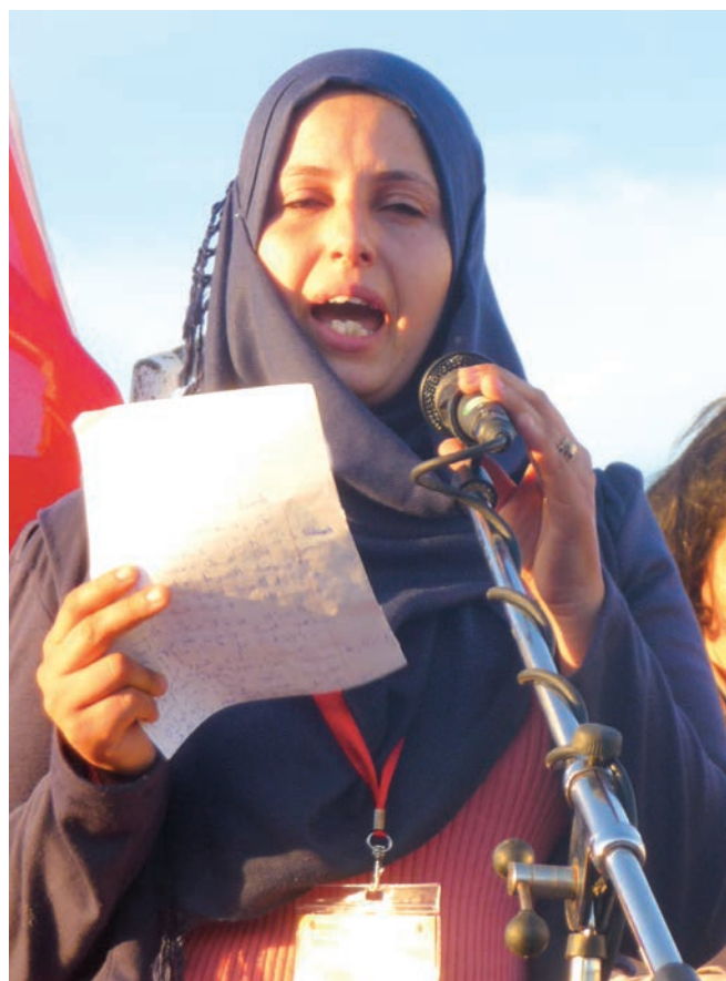
Monastir (Tunisie) : Mère qui déclare que les poissons sont devenus ses ennemis

La veille (7 juin) de l'investiture officielle d'Al-Sissi, je marche dans la rue et entends des cris scandés qui me font penser à une manifestation. Je ne vois aucun attroupement. C'est ma première manifestation fantôme! Des cris sans corps! Soudain, je suis dépassé par un convoi (encadré par des policiers armés) de cinq camions cellulaires avec de tout petits fenestrons grillagés. Je distingue des mains, des nez et des yeux. Je réalise que les cris à l'unisson proviennent de là. Quelques passants (discrètement) font un signe avec les doigts en forme de V, dirigé vers les camions. Ce sont des prisonniers politiques. Je prends une photo à l'aveugle, en feignant de m'intéresser à la vitrine d'une pâtisserie. Effroi.