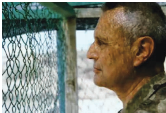
Michel Subor dans Beau travail