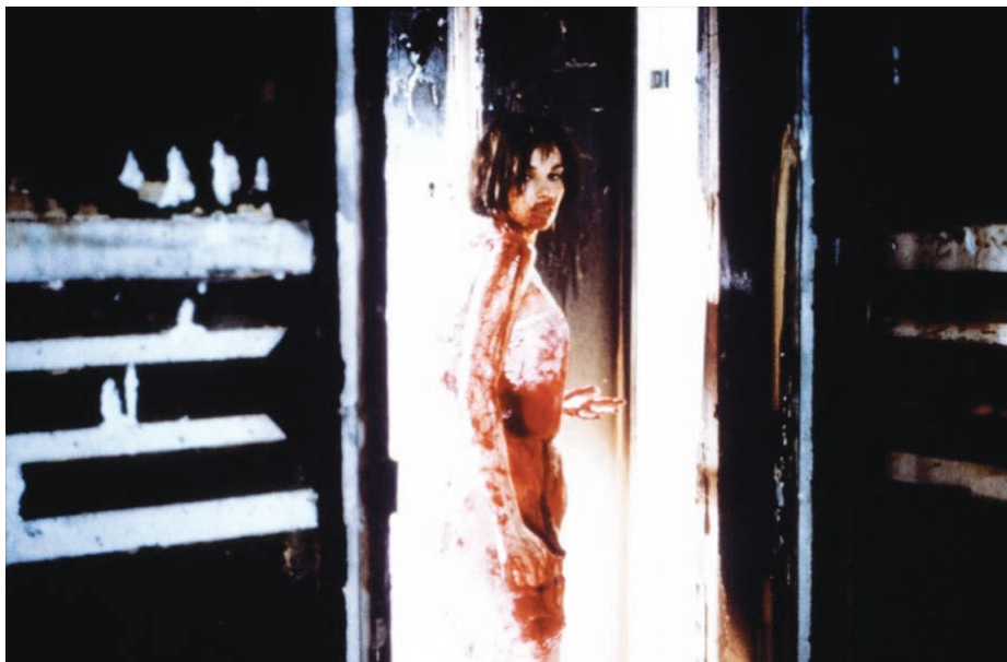
Trouble Every Day (2001)

dans le cadre une présence qui est très exotique pour moi, car c'est une femme d'une autre nature que la mienne. L'exotisme, c'est de ne pas arriver à devancer les gens qu'on filme, il faut alors s'accorder à eux comme en danse pour faire disparaître cet exotisme premier.