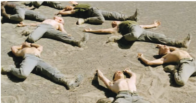
Beau travail (1999)

C.D. : C'était un acteur mystérieux pour moi. J'ai découvert tardivement Le petit soldat , je trouvais que ce film parlait bien de la guerre d'Algérie, en se posant la question, à travers le personnage de Bruno Forestier incarné par Subor: Est-ce que j'ai un idéal dans cette affaire-là? Au moment où l'on préparait Beau travail , nous cherchions un comédien pour interpréter le commandant et je me suis demandé ce que devenait Michel Subor. Entre Le petit soldat et l'homme que j'ai retrouvé, beaucoup d'années s'étaient passées. Mais dès qu'il est arrivé à Djibouti avec son treillis, les gens le saluaient comme s'il était