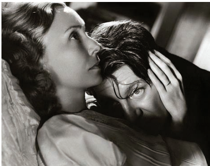
Remorques (1941) de Jean Grémillon

Cinéaste de la passion ( Corps à cœur, Once More, Femmes, femmes ), Paul Vecchiali est aussi un cinéphile passionné. À 83 ans bien sonnés et officiellement retraité, il n'en tourne pas moins un film par année et nous propose aujourd'hui les quelque 1 800 pages d'une encyclopédie fort peu académique des « cinéastes français des années 1930 et leur œuvre ». Sont ici répertoriés (notes biographiques et filmographiques) par ordre alphabétique tous les cinéastes « ayant travaillé en France, ou pour la France, de la naissance du parlant jusqu'à la fin de l'année 1939 » – avec extension dans le temps puisque l'auteur prend en compte les films de chaque cinéaste jusqu'à la fin de sa carrière : les 26 pages (hautement polémiques !) consacrées à Renoir sont exemplaires de la méthode Vecchiali.