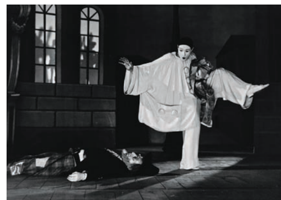
Les enfants du paradis (1945) vient d'être numérisé par les laboratoires Éclair.