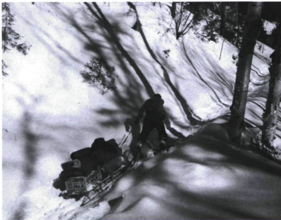
On tire la marchandise dans les bois, en hiver, à l'aide d'un traîneau.