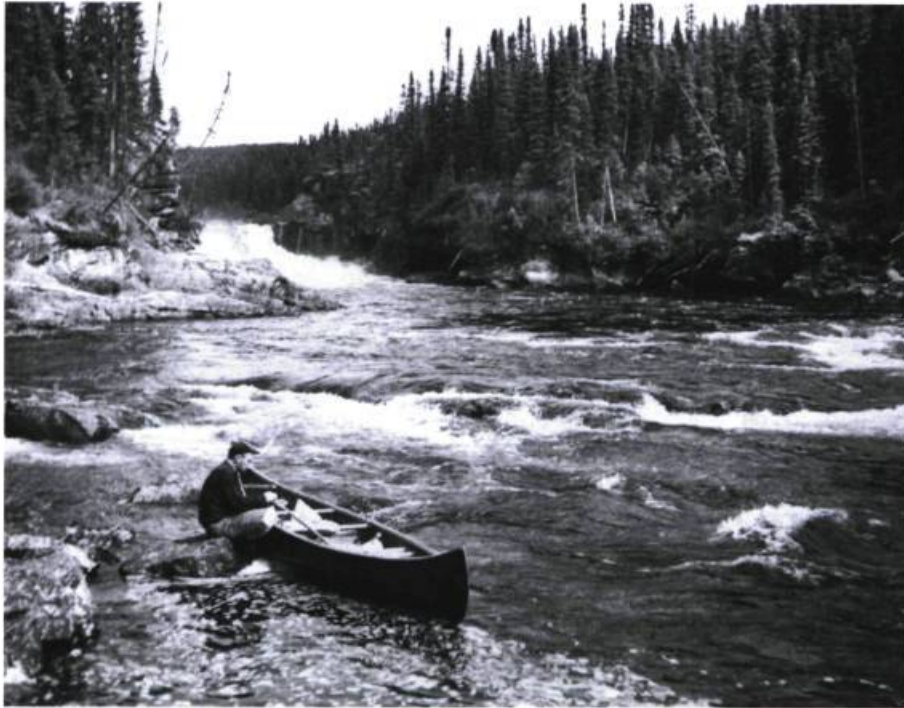
Halte aux abords de rapides.