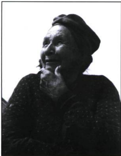
« Joie Montagnais ».