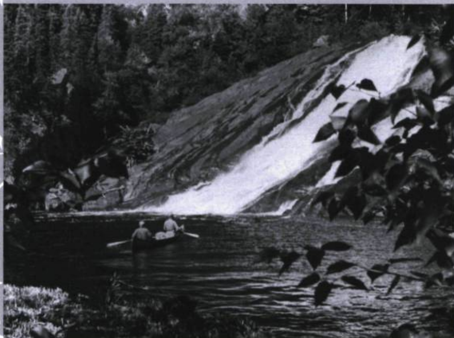
« Chute à Huard », Franquelin, vers 1930-1950.