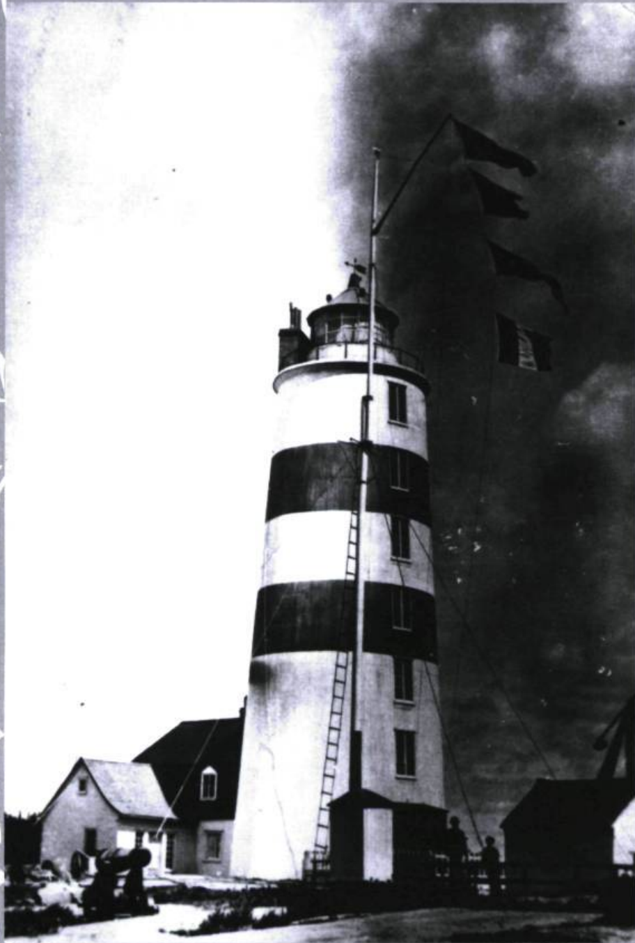
Le Phare de Pointe-des-Monts en 1905.