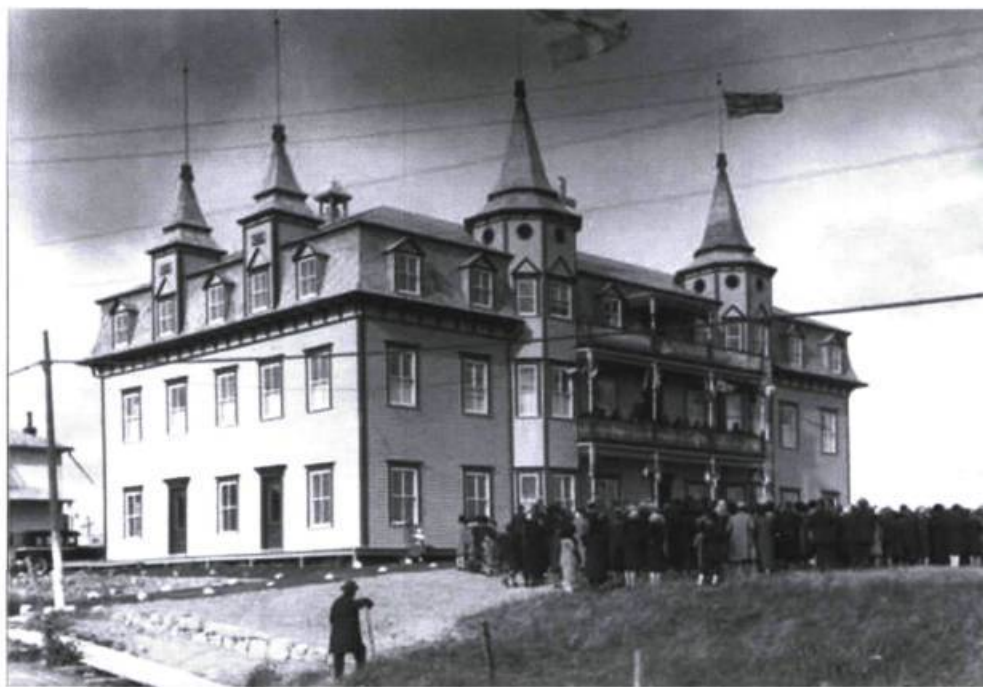
L'hôtel Chibougamou converti en maison d'enseignement (Mario Lalancette).

L'école connaît un taux de fréquentation des plus intéressants. En 1921, on confie la tâche éducative à des enseignantes. On s'aperçoit peu à peu que ces dernières rencontrent de sérieuses difficultés à faire accepter la discipline. Afin de freiner cette insubordination qui perdure, la commission scolaire et le curé Bluteau en viennent à la conclusion que les frères-édu-