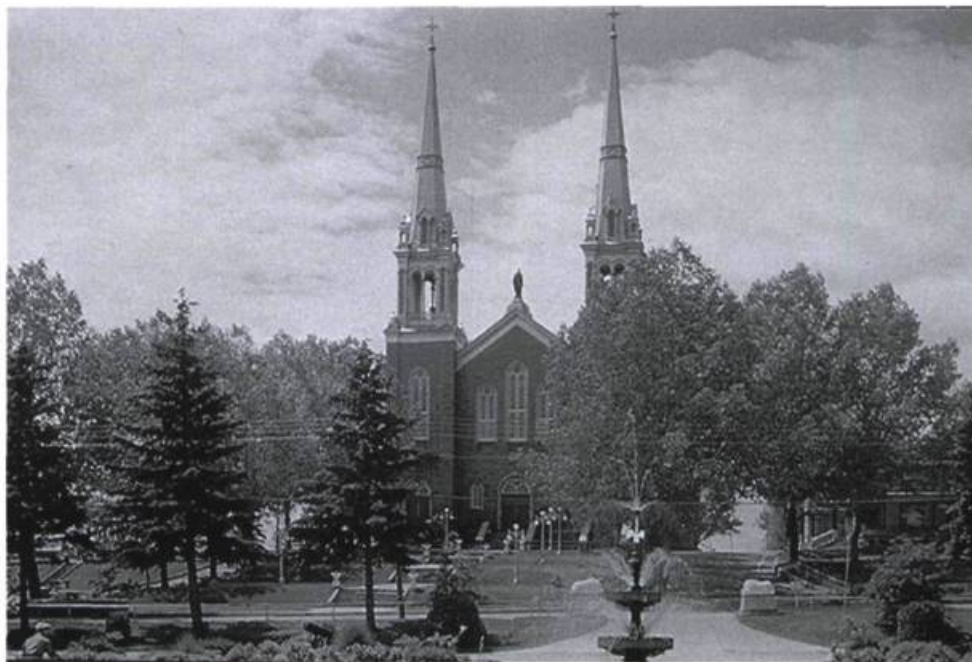
L'église de Saint-Félicien (carte postale ancienne)

chevaux durant les célébrations, les cultivateurs délaissent la pratique religieuse. Le deuxième motif demeure le plus important pour eux: étant donné que la dîme représente le 26 e des récoltes de céréales, les cultivateurs se disent victimes de leur statut social et ne supportent pas d'en donner plus que les villageois.