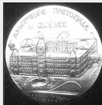
Médaille de l'Assemblée nationale