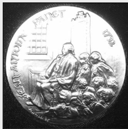
Médaille de l'Assemblée nationale

Sincères félicitations, Monsieur le président, nous sommes fiers de vous !