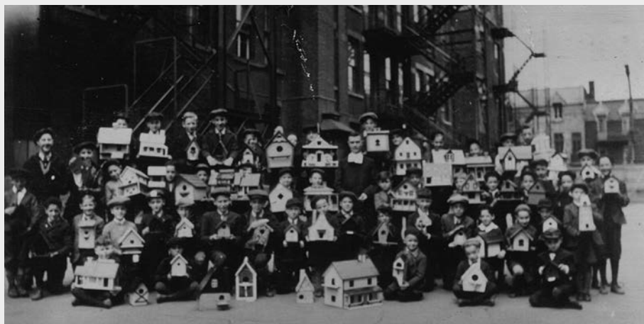
Concours de maisonnettes d'oiseaux, Cercle de l'école Sainte-Brigide à Montréal en 1940.