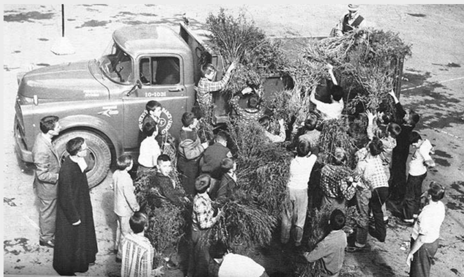
Éradication de l'herbe à poux par un cercle de jeunes à Montréal, circa 1955.

Dans les années 1980, les CJN réalisent des outils d'animation au goût du jour : la série de cahiers d'activités Le Naturaliste , une série de diaporamas sur les écosystèmes québécois, des logiciels d'identification des arbres, des insectes et des roches, le guide de sensibilisation aux sciences naturelles, la série l'Évolution et Les Ateliers , une brochure présentant aux animateurs des jeux à réaliser avec les jeunes sur différents thèmes des sciences naturelles. En 1981, c'est aussi le 50 e anniversaire des CJN. L'implantation d'un programme de sciences de la nature