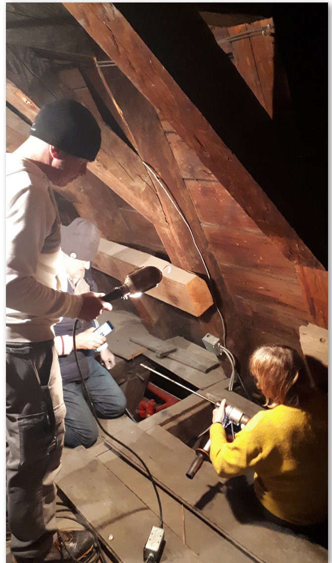
Carottage de la charpente de l’église du monastère de l’Hôpital général de Québec, 25 janvier 2020.