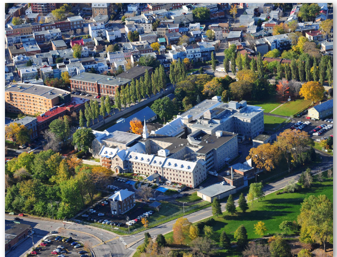
Hôpital général de Québec, monastère et CHSLD. Photo Pierre Lahoud, 2009.

Intégrée depuis 1693 à l'ensemble conventuel des Augustines de l'Hôpital général de Québec, l'église des Récollets n'a pas subi d'incendie, elle était hors de portée des boulets lors de la Conquête et est encore en usage