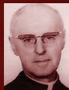
Prix Honorius Provost