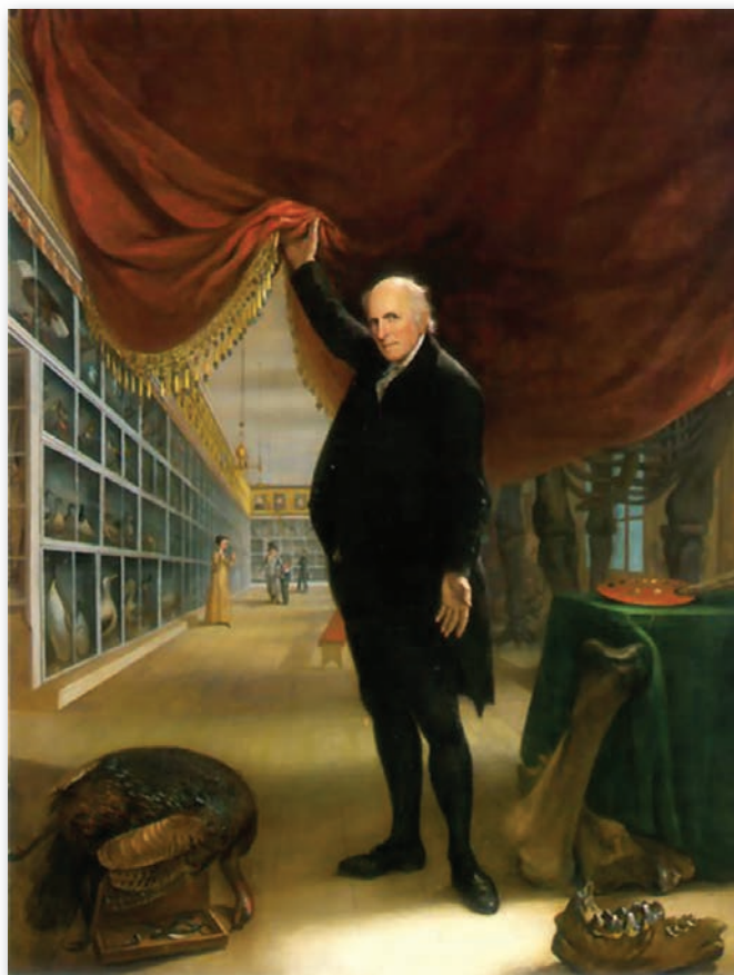
The Artist in His Museum (autoportrait, 1822) est exposé à l'Académie des Beaux-Arts de Pennsylvanie, à Philadelphie.