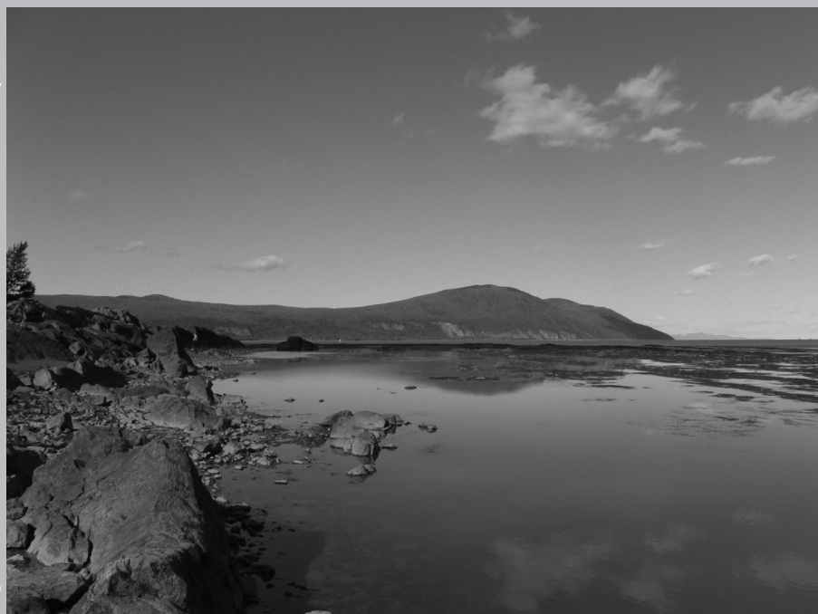
La pointe est de l'île d'Orléans, ou pointe d'Argentenay.

Au fur et à mesure que progresse le xx e siècle, la beauté naturelle de l'île d'Orléans séduit de plus en plus, alors que l'intérêt pour le mode de vie traditionnel s'estompe.