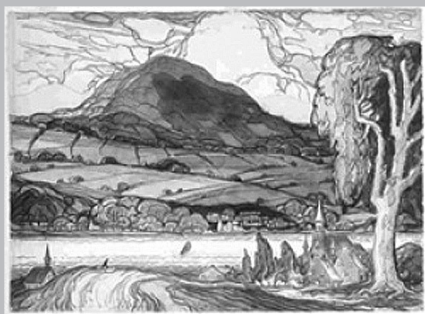
Sainte-Famille, île d'Orléans, 1941, aquarelle et craie noire sur papier, Marc-Aurèle Fortin.

André Biéler habite à l'île d'Orléans de 1927 à 1930. Immigrant suisse, il y retrouve un peu de sa terre natale. Il écrit qu'à l'île, « tout me semble agréable, le climat, les gens, et par-dessus tout le paysage qui, de tous les points de vue, est le plus beau que j'ai vu au Canada » 3 . Biéler s'intéresse aux activités quotidiennes de ses habitants encore marquées par les traditions mais déjà influencées par le progrès. L'environnement naturel occupe une grande place dans son œuvre. À l'île d'Orléans, comme dans les nombreuses scènes de campagne qui composent la plus