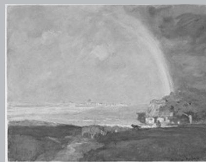
L'Arc-en-ciel, huile sur toile, 1893 (41,7 X 53,8 cm). Horatio Walker exprime la présence des grands espaces et l'importance des phénomènes naturels à l'île d'Orléans.

Après l'établissement permanent des immigrants français, à partir de 1650, trois visions de la nature