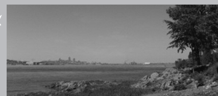
La pointe ouest de l'île d'Orléans.