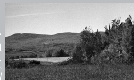
Récolte d'automne à Saint-Pierre, île d'Orléans.

qui y ont élu domicile ces vingt dernières années témoignent de la valeur toujours actuelle de cette île ensorceleuse comme source d'inspiration.