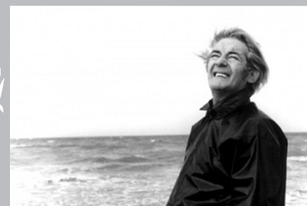
Félix Leclerc à l'île d'Orléans, vers 1975.

Le tourisme est devenu la seconde activité économique en importance à l'île d'Orléans. Les fers de lance de cette industrie sont le riche patrimoine historique, la variété des produits agroalimentaires de qualité et la beauté naturelle des paysages. On peut lire dans la Politique patrimoniale et culturelle de l'île d'Orléans , promulguée en 2005 dans le but de mieux conjuguer traditions et développement, que les paysages « forment à eux seuls une ressource patrimoniale exceptionnelle et comptent parmi les plus pittoresques et les plus recherchés du territoire québécois » 5 . Les dizaines d'artistes