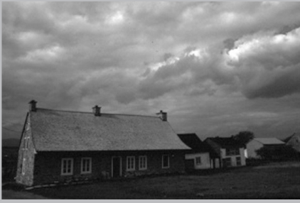
Maison ancestrale du régime français à Saint-Pierre, île d'Orléans.

générosité des ressources naturelles. Puis on a remarqué l'harmonie qui régnait entre ce grand potentiel et les habitants de l'île qui, en grande majorité, pratiquaient l'agriculture. Enfin, le charme de ses paysages n'a fait qu'ajouter une autre valeur à tout cet équilibre.