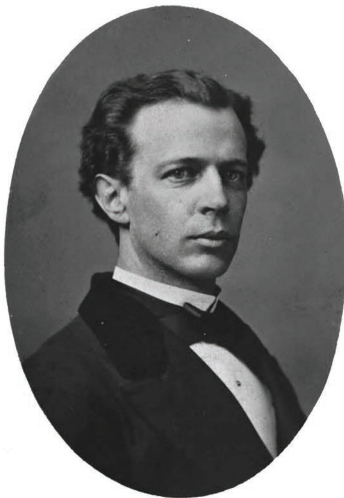
Wilfrid Laurier – 1869.

Wilfrid Laurier naît en 1841, soit quatre ans après la révolte des Patriotes et deux ans après la pendaison de François-Marie-Thomas (Chevalier) de Lorimier. Autre chose connue, que l'on peut affirmer sans crainte, est que le jeune Wilfrid a toujours été attiré par la politique, étant contaminé par ce virus dès son plus jeune âge. Et il ne faut pas chercher très loin pour savoir où il a contracté la maladie. À Saint-Lin, à la résidence familiale des Laurier, il s'agit d'un sujet de conversation