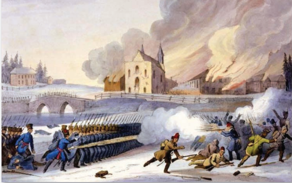
Estampe : Vue de la façade arrière de l'église de Saint-Eustache et dispersion des insurgés, 14 décembre 1837.

Entre autres, non plus celle de l'opposition tous azimuts à la possibilité d'une Confédération, mais celle de la valorisation des deux « races fondatrices », du respect des juridictions provinciales et de la tradition du droit britannique. Alors qu'il est premier ministre et qu'une personne lui dit qu'il semble avoir conquis les canadiens anglais, Laurier lui répond : « N'oubliez pas que pour eux nous aurons toujours la tache originelle. » N'est-ce pas là la confirmation d'un être lucide ou dépourvu de la moindre trace de naïveté et qui sait que rien n'est jamais acquis, surtout en politique? Alors, lorsqu'on classe Laurier comme un inconditionnel Canadien il faut apporter des nuances. Lui-même ajoutera que « le Canada a été l'inspiration de sa vie », à l'exemple d'une œuvre d'art et de ce qu'on qualifierait aujourd'hui de création en cours ( work in progress ).