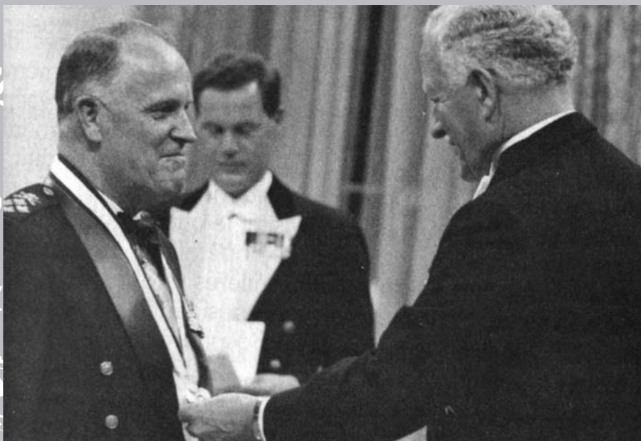
Le 12 novembre 1968, le gouverneur général Roland Michener le fit Compagnon de l'Ordre du Canada.

assuma une seconde fois la fonction de commandant du secteur est du Québec. Son ascension militaire ne s'arrêta pas là. Le 1 er avril 1958, il était promu au grade de major-général. Trois ans plus tard, la reine Élisabeth II approuvait sa nomination au poste de général commandant de la 4 e Division britannique du Rhin en Allemagne de l'Ouest. Il devenait ainsi le premier Canadien à commander une division britannique. Enfin, en 1961, après deux ans en Allemagne, il