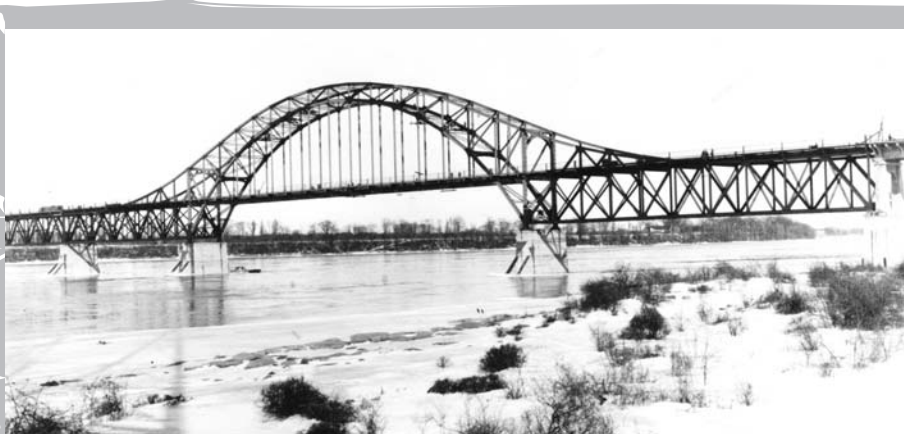
Le 15 mars 1934, vue générale du pont Honoré-Mercier, les travées 11, 12 et 13 terminées.

Le service de passagers prend fin en 1978 à la gare de LaSalle avant de reprendre des années plus tard sous une autre forme. Cette ancienne gare n'est plus