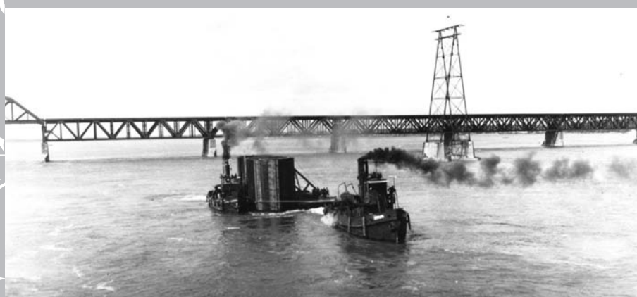
Le 29 septembre 1933, lors de la construction du pont du lac Saint-Louis entre Kahnawake et LaSalle : caisson arrivant tout assemblé de l'usine de la compagnie Dominion Bridge de Lachine; à l'arrière plan, le pont Saint-Laurent du Canadien Pacifique.