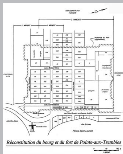
Premier tracé du chemin du Roy au village de la Pointe-aux-Trembles sur la rue Saint-Louis, laquelle fut érodée par les glaces au tournant du XIX e siècle. (Source: MARSAN, Jean-Guy, Le terrier primitif de Pointe-aux-Trembles dans la seigneurie de l'Isle de Montréal, Rimouski , 2006)

Le balisage des chemins en hiver incombait également aux