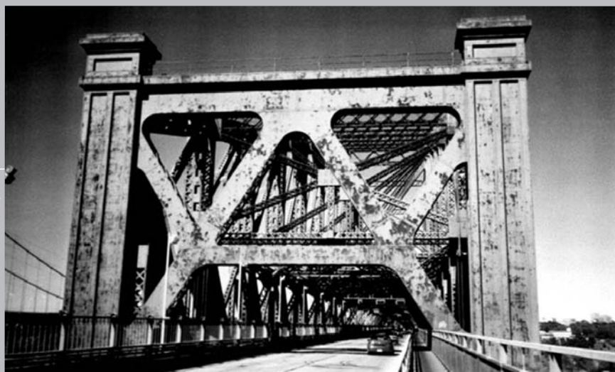
Photo prise en 1995 montrant le pont de Québec envahi par la rouille qui se fait de plus en plus présente sur la structure.

En terminant, il faut espérer que ce nouvel épisode dans l'histoire mouvementée du pont de Québec connaisse un dénouement heureux. Cette œuvre de génie civil jouit de tout le potentiel nécessaire pour redevenir une attraction d'envergure et un joyau de l'industrie touristique régionale, s'il est préservé et mis en valeur comme il le mérite.