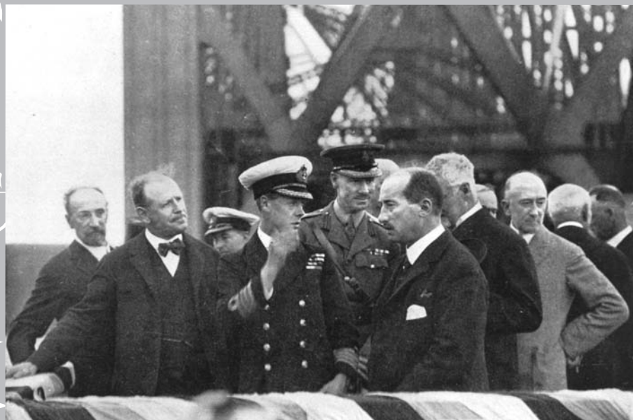
Inauguration officielle du pont de Québec par le prince de Galles (futur Édouard VIII), le 22 août 1919.

La nouveau produit pour repeindre le pont (côté nord) présente déjà après 4 ans des signes démontrant une usure prématurée et ne respecte pas la garantie annoncée par le fabricant.