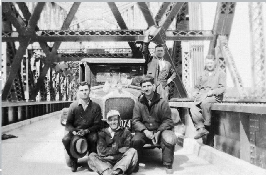
Ouverture de la première voie carrossable sur le pont de Québec, le 22 septembre 1929.

de 1917, le pont met la ville et la région en communication directe avec la rive sud du Saint-Laurent et les États-Unis, et rend ainsi possible l'entrée dans la ville de Québec de nombreuses compagnies de chemin de fer qui sillonnaient jusqu'alors la rive sud.