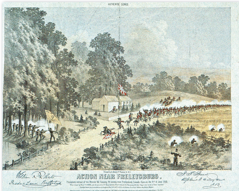
Lithographie couleur de propagande produite par la Fenian Brotherhood en 1867 pour commémorer les accrochages contre la cavalerie canadienne de juin 1866 à Frelighsburg (Frelighsburg). L'action militaire présentée est manipulée car dans l'escarmouche entre les Royal Guides et les Fénians, aucun mort ne fut déploré.

Dès les premiers jours de l'invasion contre le Canada, le gouverneur général Lord Monck suit heure par heure le déroulement des événements par télégraphe, depuis sa demeure officielle à Ottawa. Dès le 9 juin, les télégrammes arrivent de la frontière québécoise, indiquant la capture de plusieurs Irlandais d'origine américaine par les troupes britanniques, La Minerve confirmant le nombre des prisonniers dès le 11 juin 1866. « Les Guides furent très exposés et se conduisirent admirablement bien. Ils firent 5 prisonniers. Les autres compagnies en firent aussi et il y en a actuellement 15 entre nos mains. Deux sont blessés, l'un peut-être mortellement. » Monck est également en contact avec le ministre consulaire britannique à Washington, Sir Francis Bruce, sur une ligne