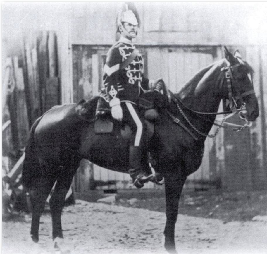
Caporal de cavalerie des Royal Guides en 1866. Constitué en 1862 pour la protection rapprochée du Gouverneur général au Canada East (Québec), le corps de cavalerie des volontaires de Montréal ou Royal Guides est l'unité d'élite qui affronte les Féniens sur la frontière entre Frelighsburg et Saint-Armand en juin 1866. Leur uniforme est une tunique bleue avec fourragère et cordon blanc ayant un casque métallique de style dragon avec un crin couleur rouge sur la pointe.