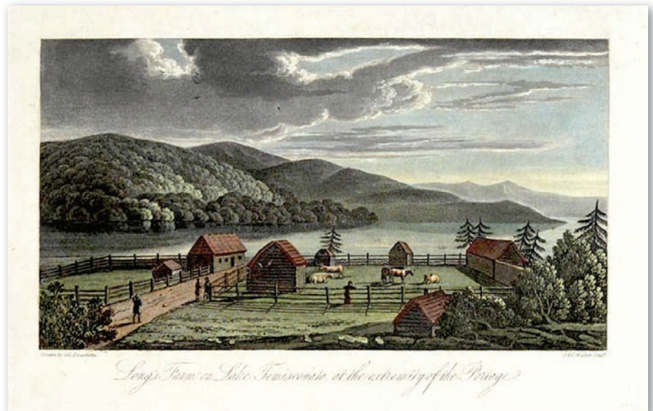
La ferme Long au lac Témiscouata, à l'extrémité du Portage, Peter Winkworth's. (Source : Collection - Archives Canada)

Mais c'est la guerre de 1812 qui fera constater aux autorités britanniques l'importance de la route intérieure. À l'hiver 1813, des renforts sont demandés d'urgence dans la région des Grands Lacs 23 . C'est alors que le 16 février 1813, un contingent de 554 hommes du 104 e Régiment d'infanterie du Nouveau-Brunswick quittera Frédéricton pour une longue route de plus de 1300 kilomètres en direction de Kingston. Arrivé au Témiscouata, le régiment est frappé par une horrible tempête. Immobilisées, les troupes deviennent complètement désorientées et perdent leur chemin vers le prochain lieu de ravitaillement, soit la ferme de Philip Long. C'est alors que le lieutenant Charles Rainsford et deux Canadiens