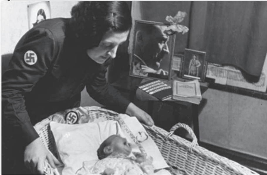
Une militante du parti avec son « nouveau petit fasciste ».