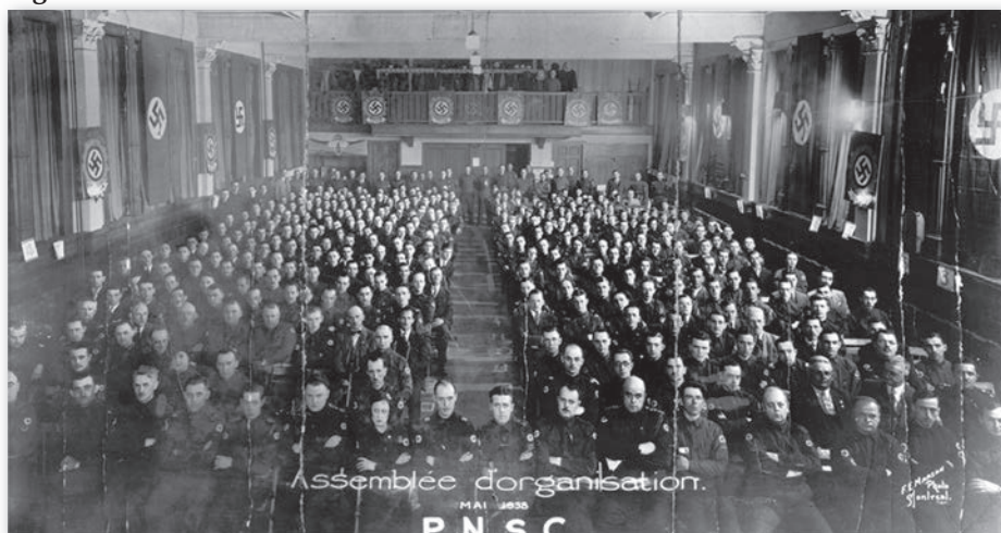
Photo d'une assemblée du PNSC.