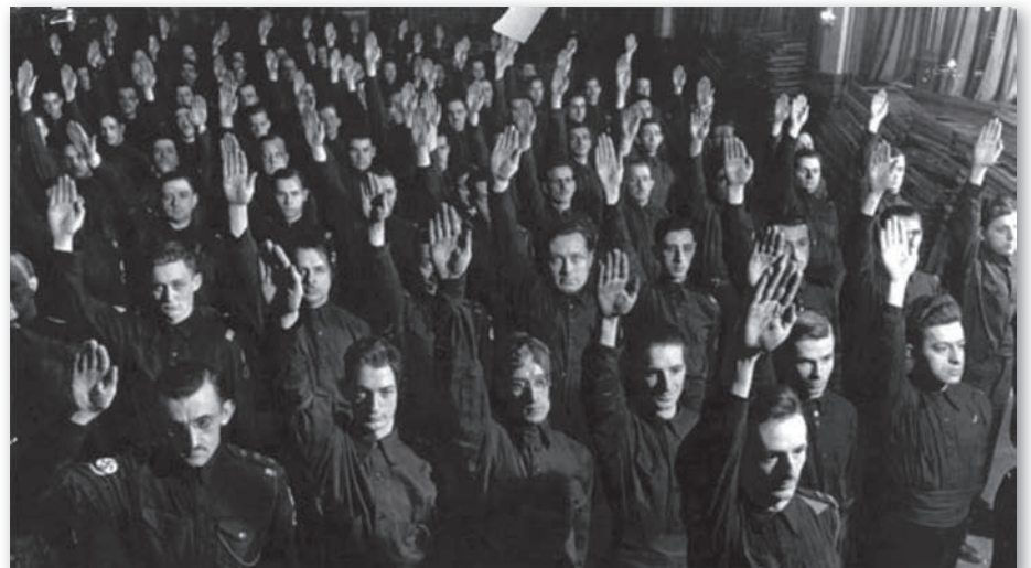
Les Légionnaires.

payer une contribution mensuelle et s'abonner au journal Le Fasciste canadien . Chaque membre a aussi des devoirs, comme celui de propagande pour assurer la diffusion des idées du parti et recruter de nouveaux membres, hommes ou femmes.