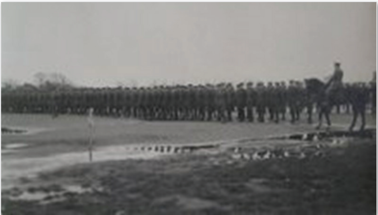
Inspection par le major-général Leckie de la compagnie C (Montréal) du 259 th Battalion au Willows Camp, Victoria (Colombie-Britannique), novembre 1918.

Le 259 e Bataillon s'embarqua pour la Russie, à Victoria (Colombie-Britannique), les 22 et 26 décembre 1918. « À Victoria, quelques agitateurs persuadèrent un certain nombre de Québécois membres du 259 e Bataillon de se mutiner en refusant de s'embarquer pour la Russie. Il y eut douze