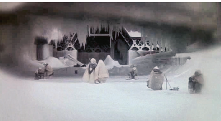
Le pavillon thématique de l'Expo 67. Transfiguré pour Quintet, 1979.