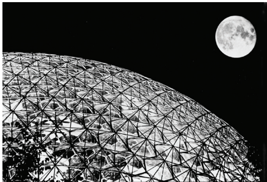
La pleine lune et le pavillon des États-Unis d'Amérique à l'Expo 67. © Estate of Richard Buckminster Fuller.