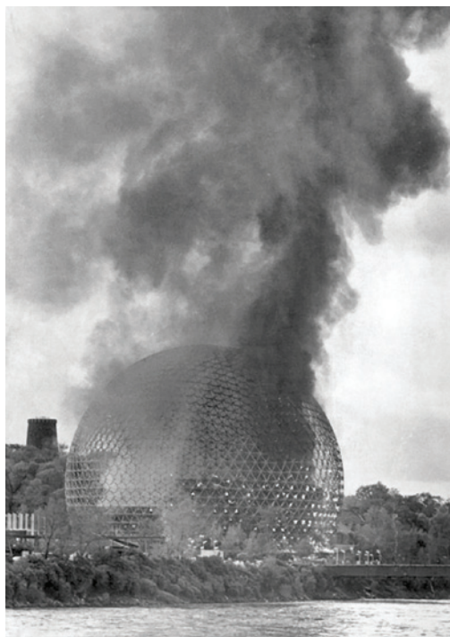
La géosphère en flammes, 20 mai 1976.

À une échelle plus domestique, ma génération a connu l'avènement de la télévision câblée et de la télécommande, de la micro-informatique et du Web, le passage du Walkman au iPod, la démultiplication de la téléphonie cellulaire, puis de ses incarnations dites intelligentes ... J'ai vécu les derniers jours de l'ascendant catholique sur l'éducation québécoise, connu les lueurs déclinantes d'Expo 67, cité d'humanisme postchrétien émergée des eaux du fleuve pour motiver les espoirs les plus brillants, et annoncer l'ère de la simulation à venir. (À noter que j'y dois mon existence, puisque c'est là que mes parents ont commencé à se fréquenter). J'ai vécu l'atterrissage du stade olympique sur la planète Hochelaga, les échecs référendaires répétés de nos forces rebelles, l'exil d'une certaine élite anglophone argentée et l'ascendance métropolitaine de Toronto... L'époque de mon enfance était