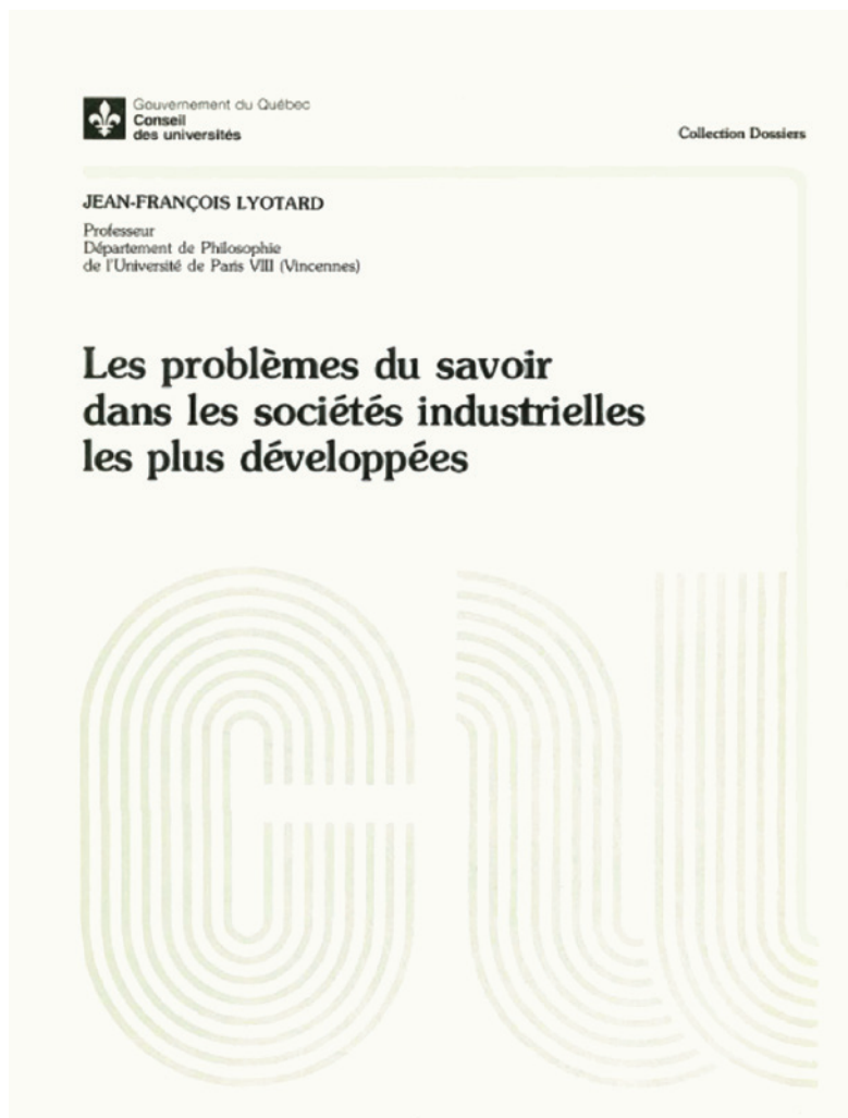
Jean-François Lyotard, Les problèmes du savoir dans les sociétés industrielles les plus développées , Conseil des universités, Québec, 1979.

et ce, l'année même où Robert Altman tournait sa dystopie dans les ruines de notre futur antérieur ? Ou que la description de la ville irréaliste avec laquelle Jean Baudrillard ouvre son best-seller de notre inexistence relative, Amérique (1997), a été inspirée par le centre-ville de Montréal ?