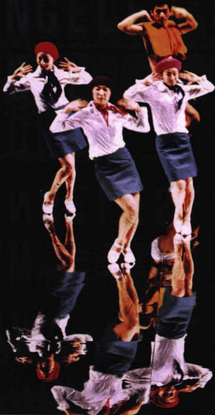
Dumb Type, Voyage, 2002-2008.