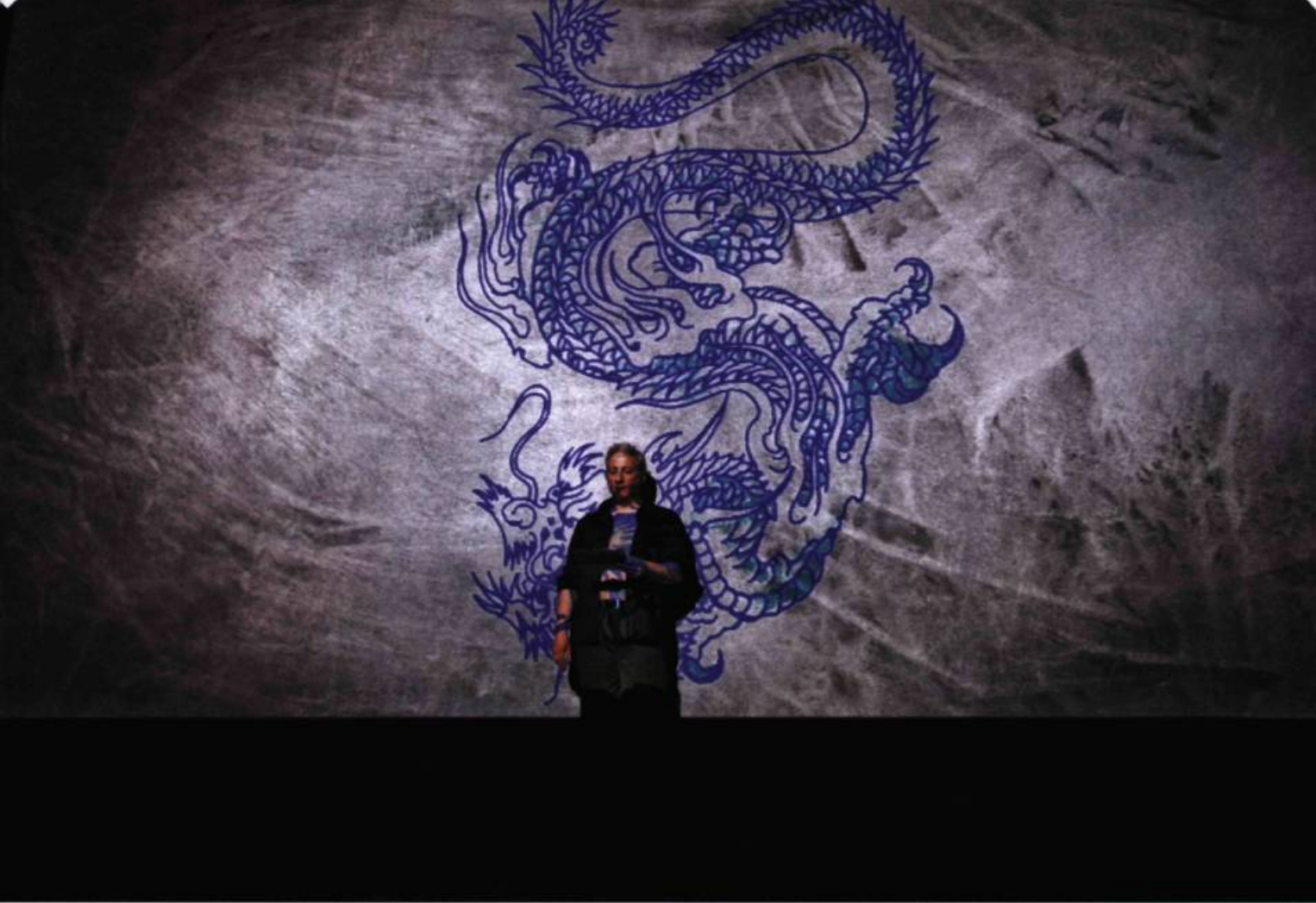
Robert Lepage, Dragon Bleu . Répétition générale avant la création au théâtre de Chalon en Charnagne (France).

de chacun, qu'ils personnalisent dans leurs déplacements incessants (une batterie, un bureau, un coin coussins, un ciel empli de flocons de nuages en polystyrène, pour l'Italienne de 6 ans qui se rêve en « hôtesse du ciel »). Nous serions dans un hangar d'aéroport dans lequel conteneurs comme enfants vont pouvoir être transportés, pendant que l'on filme des escargots se déplaçant sur une mappemonde et traversant des pays, voire des continents, en quelques instants, métaphore efficace !