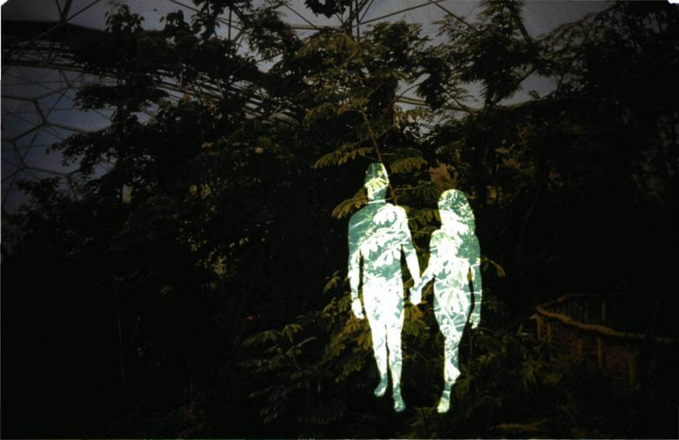
Maslen & Mehra, Past is the Future (détail), 2004. Installation; 3 m x 14 m. Exposition Gods Becoming Men , Musée Frissiras, Athènes, présentée aux Jeux olympiques d'Athènes, 2004.