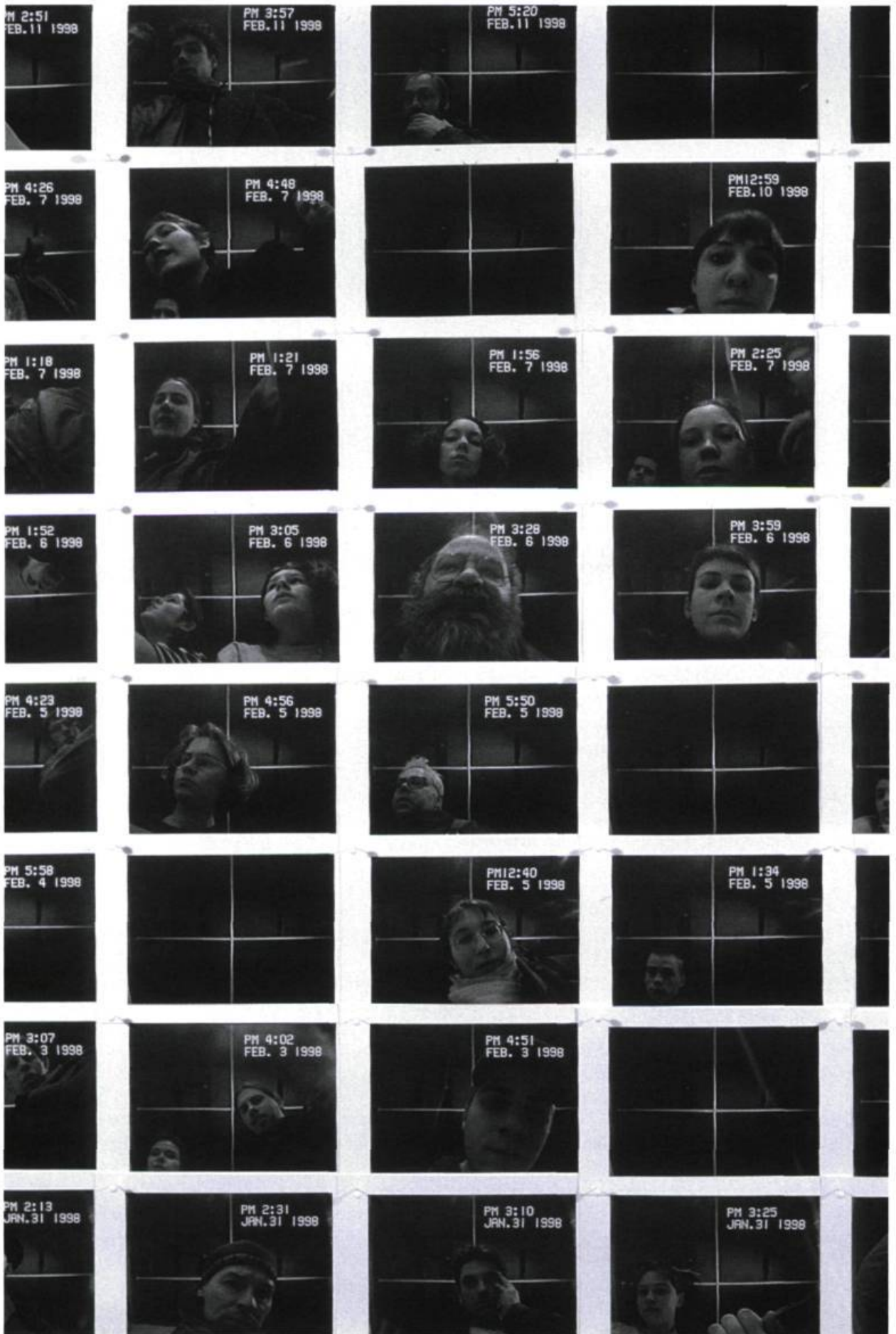
Chantal duPont, Cabinet de portraits , 1998. Photographies numériques.