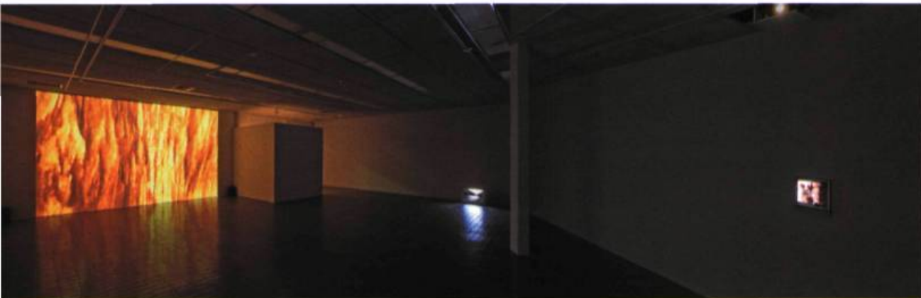
Bertrand R. Pitt, Tumultes , 2004. Installation vidéo à 3 canaux. Photo : Guy L'Heureux, montage : Bertrand R. Pitt.